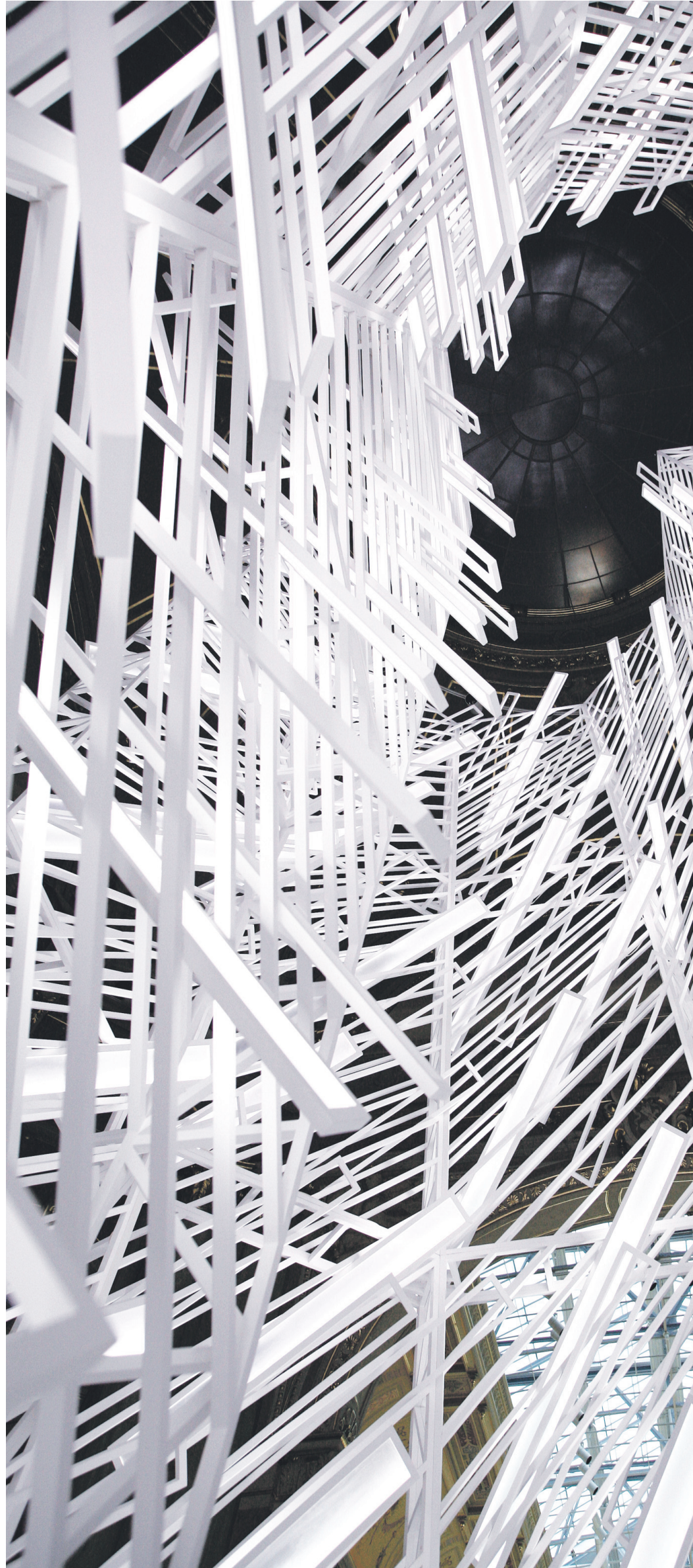
S izložbe Petra Barišića Bijelo u Umjetničkom paviljonu, 2008. (snimio Fedor Vučemilović)

Odatle i ona naoko nerješiva nedoumica glede čovjekova primjerenog odnosa spram tehnike. Iluzorno je pomišljati da bi čovječanstvo ikad moglo ovladati tehnikom, budući da je ona do svoje pune uspostave mogla dospjeti samo time da joj se čovječanstvo prethodno bezuvjetno