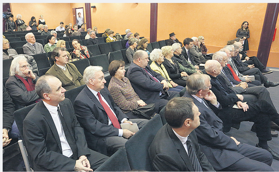
Matičina dvorana bila je ispunjena usprkos lošem vremenu

Kao što središnjicu Matice želimo vidjeti