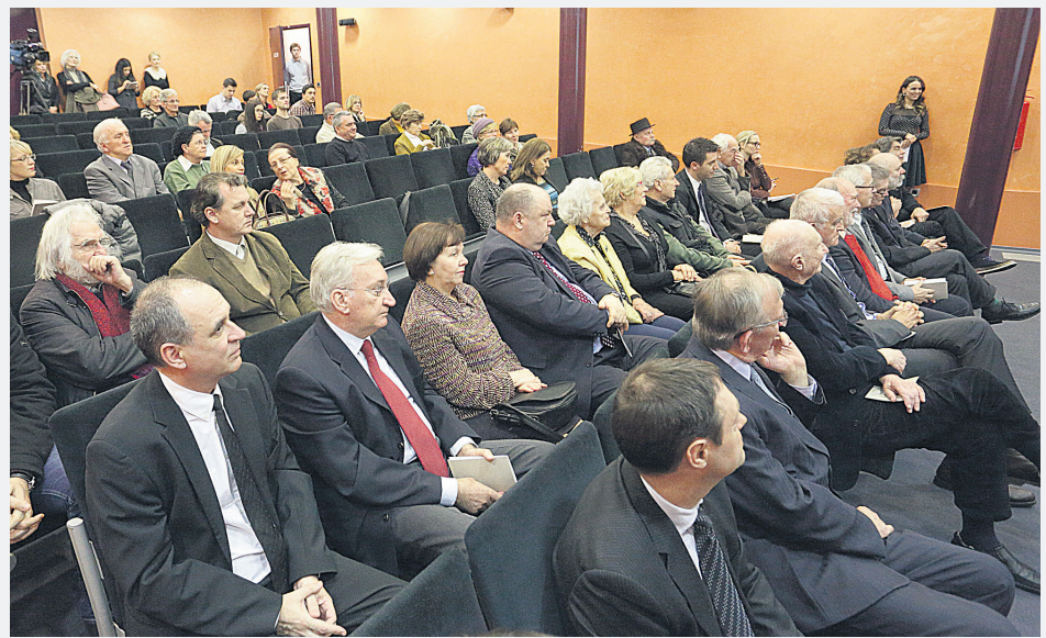
Matičina dvorana bila je ispunjena usprkos lošem vremenu

Kao što središnjicu Matice želimo vidjeti