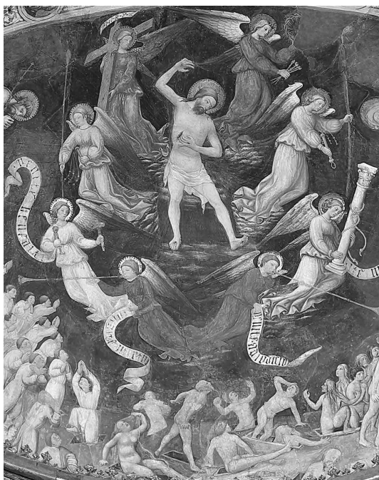
FIG. 3. N. DELLI, Giudizio Finale , particolare. Salamanca, Cattedrale Vecchia.

dei chiodi compare anche sulla mano che condanna e quella sul costato è egualmente visibile ai dannati. 1 Sembrano valere anche qui le parole del Cristo nel sermone pseudo-agostiniano ricordato sopra: «Videtur vulnera quae infixistis, agnoscitis latus quod popugistis: quoniam et per vos et propter vos apertum est, nec tamen entrare voluistis. Qui non estis redempti pretio mei sanguinis, non estis mei: discedite a me in ignem aeternum qui paratus est diabolo et angelis eius ». 2 Da questo punto di vista, non mi pare che l'affresco di Michelangelo – pur nella sua grande e, per tanti contemporanei, scandalosa novità – si sia allontanato molto da questa tradizione.