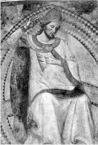
FIG. 2. BUFFALMACCO, Giudizio Universale , particolare. Pisa, Camposanto.

ritrova – anche se con notevoli differenze – negli affreschi di Buffalmacco nel Camposanto di Pisa (anni Trenta del Trecento, FIG. 2) e nell'affresco absidale di Niccolò Delli nella Cattedrale Vecchia di Salamanca (1445 ca., FIG. 3). 1 Si ritrova anche nel Giudizio Universale di Michelangelo (1541, FIG. 4), la cui «terribilità» fu sottolineata da Giorgio Vasari: «con faccia orribile e fiera» – scrive – il Cristo si rivolge ai dannati, «maladidendoli», mentre la Vergine, spaventata, quasi si ritrae alla vista di «tanta ruina». 2 La croce e gli strumenti della Passione, portati da angeli, sono ritratti nelle lunette, al di sopra del Cristo. Già secondo Ascanio Condivi la gestualità asimmetrica del Cristo indicava da un lato l'ira e la condanna (mano destra), e, dall'altro, l'accoglienza amorosa dei beati nel regno celeste: con la mano