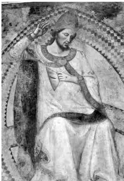
FIG. 2. BUFFALMACCO, Giudizio Universale , particolare. Pisa, Camposanto.

ritrova – anche se con notevoli differenze – negli affreschi di Buffalmacco nel Camposanto di Pisa (anni Trenta del Trecento, FIG. 2) e nell'affresco absidale di Niccolò Delli nella Cattedrale Vecchia di Salamanca (1445 ca., FIG. 3). 1 Si ritrova anche nel Giudizio Universale di Michelangelo (1541, FIG. 4), la cui «terribilità» fu sottolineata da Giorgio Vasari: «con faccia orribile e fiera» – scrive – il Cristo si rivolge ai dannati, «maladidendoli», mentre la Vergine, spaventata, quasi si ritrae alla vista di «tanta ruina». 2 La croce e gli strumenti della Passione, portati da angeli, sono ritratti nelle lunette, al di sopra del Cristo. Già secondo Ascanio Condivi la gestualità asimmetrica del Cristo indicava da un lato l'ira e la condanna (mano destra), e, dall'altro, l'accoglienza amorosa dei beati nel regno celeste: con la mano