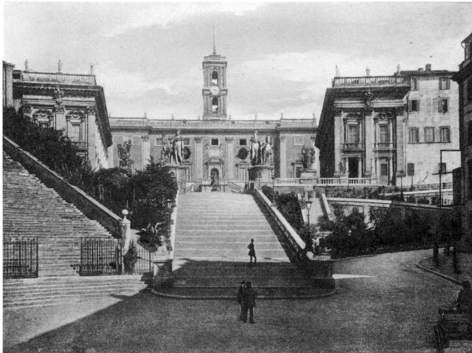
Rim – Kapitol

Prostor svakoga grada bitno je određen samo njemu svojstvenim ugodajem i upravo je taj ugođaj ono što čini njegovu neusporedivu i neponovljivu osebnost. Ugođaj Pariza posve je drukčiji od onoga koji vlada u Beču; onaj Praga neusporediv je s onim kojim je prožeta Barcelona