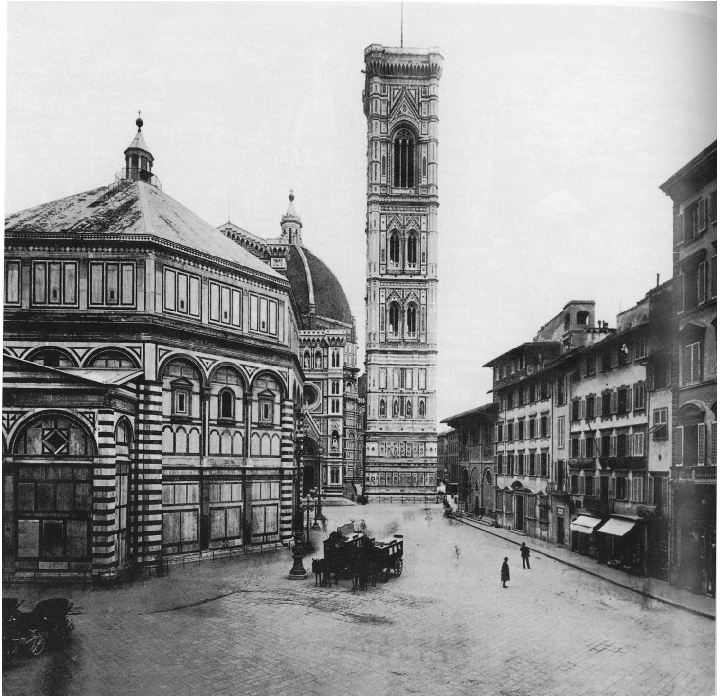
Firenca – Trg katedrale

Na osnovi utvrđenoj tim ishodišnim orijentiranjem određuju se onda dalje i omeđuju