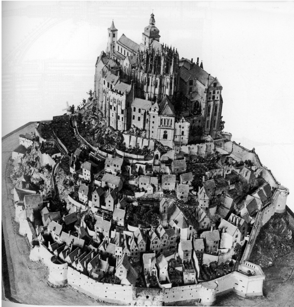
Mont Saint-Michel – model iz 18. stoljeća

Omeđenjem i raščlambom izvorno bezgraničnog prostora te gradnjom na tako položenu temelju čovjek zadovoljava svoju ele-