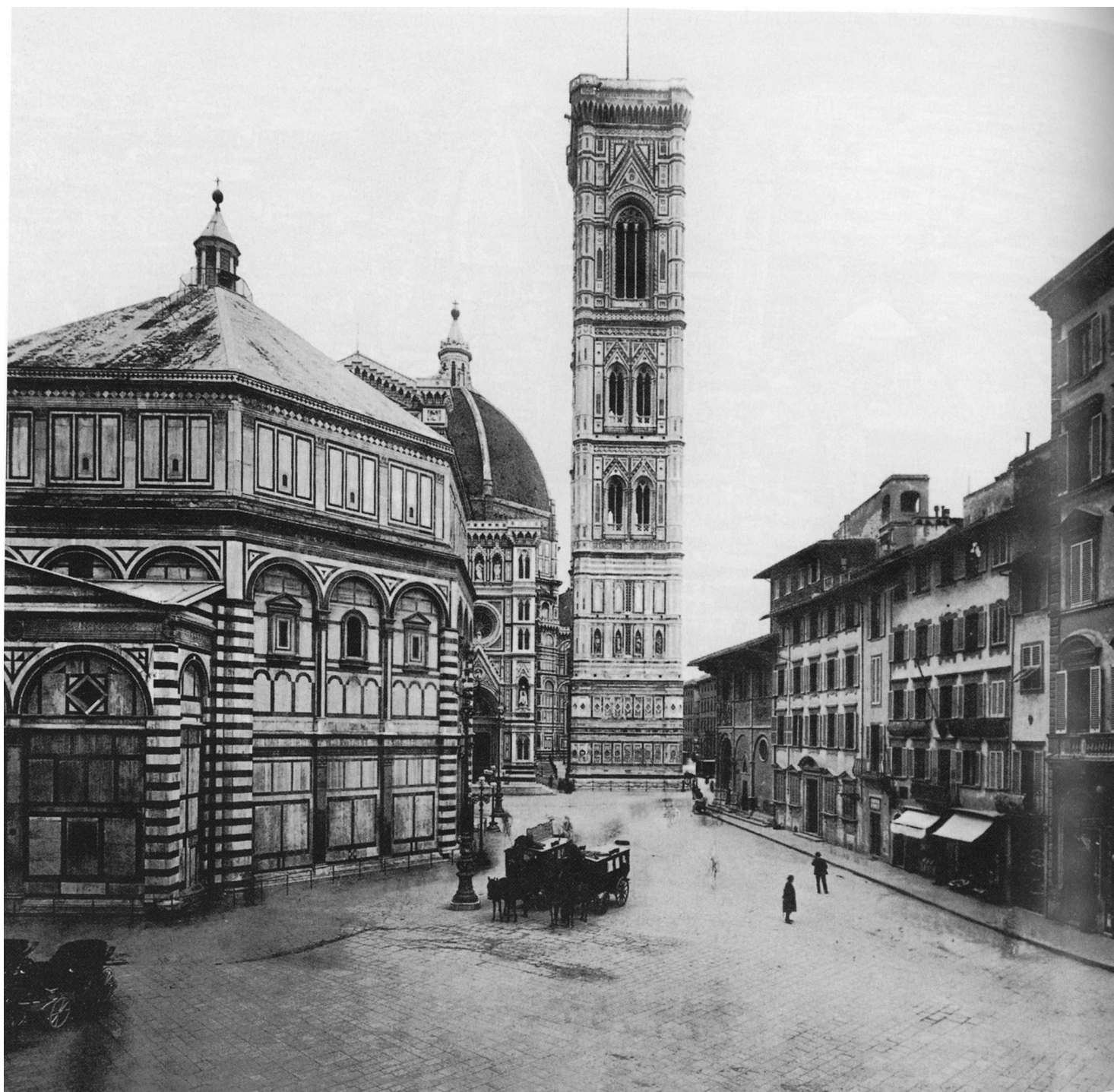
Firenca – Trg katedrale

Na osnovi utvrđenoj tim ishodišnim orijentiranjem određuju se onda dalje i omeđuju