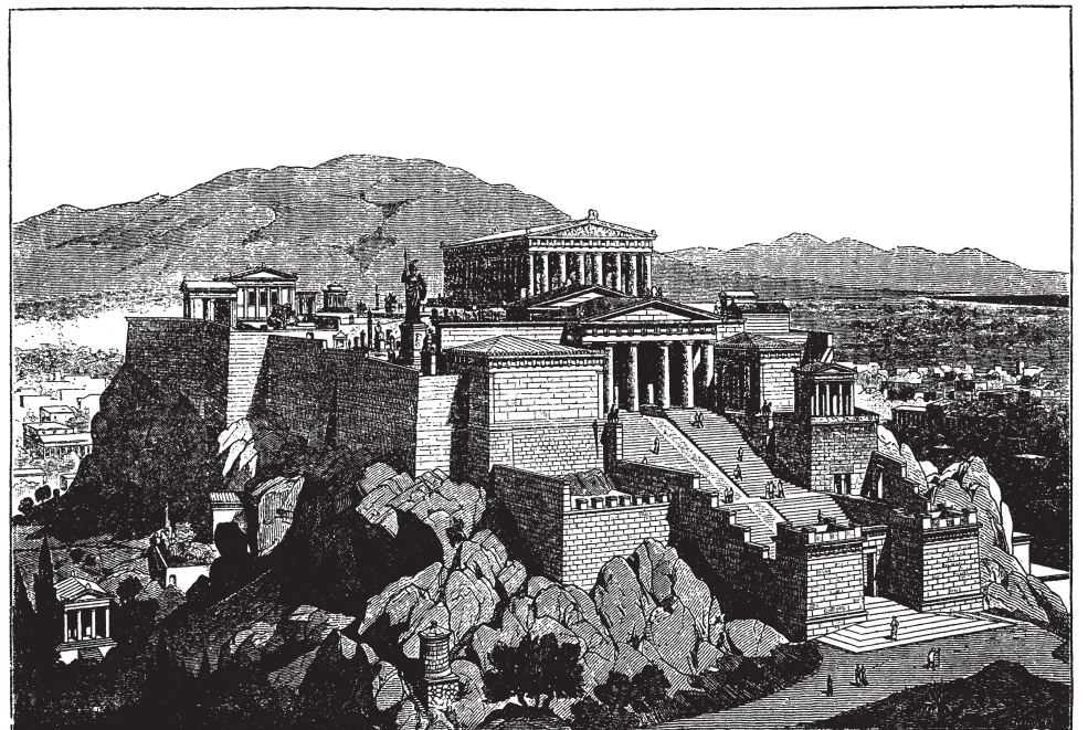
Atena – Akropola

Upravo to je izvorno značenje onoga što se u nas naziva „gradom“. Ta riječ prvotno znači „ograđeno mjesto“ odnosno „obrađeni, njegovani vrt“, što kazuju i srodne joj grčke, latinske i njemačke riječi hortos , hortus i Garten . Sve zajedno potječu iz indoeuropskog korijena * gherdh- , koji znači „ogradi“, a vjerojatno se može svesti na izvorniji korijen * gher- , u značenju „posegnuti“ odnosno „zahvatiti“. Odatle je razvidno da je prvotno, još posve elementarno značenje riječi „grad“ temeljni zahvat ograđivanja, kojim nastaje neko određeno mjesto, ali uz to i obrađivanje i njegovanje toga ograđenog mjesta. Potvrdu za to nalazimo u jednom drugom povijesno bitnom jeziku. I staro-visoko-njemačka riječ za „grad“ stat mišljena je prvenstveno iz od-