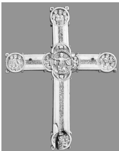
FIG. 1. Croce di Gunhild, retro. Copenhagen, Nationalmuseet.

Il Cristo giudice in trono, in posizione frontale, con entrambe le braccia sollevate simmetricamente a mostrare le piaghe, affiancato dagli angeli che portano gli strumenti della Passione e, in basso, dai cortei dei beati e dei dannati, è scolpito sui portali delle grandi cattedrali gotiche, non solo francesi, 3 e si incontra anche nelle illustrazioni miniate dell'Apocalisse, della Bibbia e dei Libri d'Ore; in queste, le ferite erano spesso raffigurate ancora sanguinanti, probabilmente in quanto continuamente riaperte dai peccati umani. 4 Particolarmente interessanti, però, soprattutto per il loro impatto emotivo, sono le rappresentazioni nelle quali la gestualità potente e asimmetrica del Cristo lo avvicina al Dio vendicatore che colpisce i peccatori piuttosto che al giudice impassibile che li separa: il braccio destro è alzato, il corpo, lo sguardo e il palmo della mano destra sono rivolti ai dannati, mentre il braccio sinistro scopre o indica la ferita sul costato. 5 Questo schema si